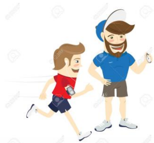
Спортсмены и тренеры, члены сборных команд