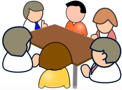
Члены Президиума ВФЛА, комитетов и комиссий