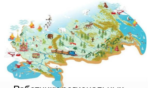
Работники региональных федераций