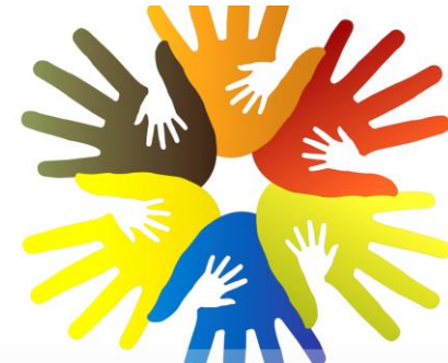
Волонтеры и иные лица, вовлеченные в легкую атлетику